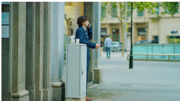
Image of product in real life situation