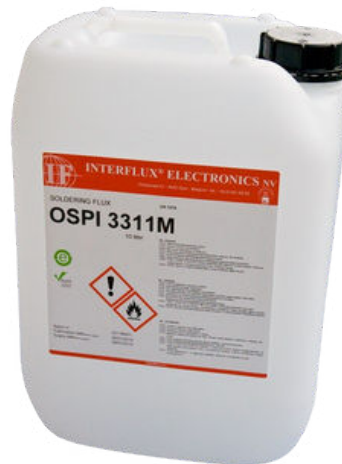
La photo n'est pas contractuelle

En plus, le flux est absolument sans halogènes et il a été développé pour être fiable. Il est conforme aux exigences IPC.