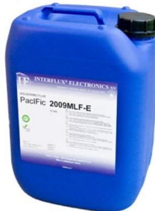
La photo n'est pas contractuelle