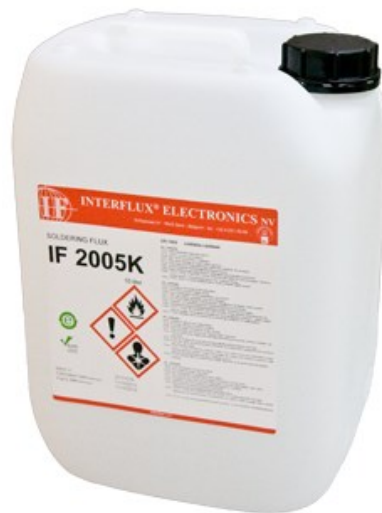
La photo n'est pas contractuelle

Le flux est classé dans les normes IPC et EN comme OR/L0.