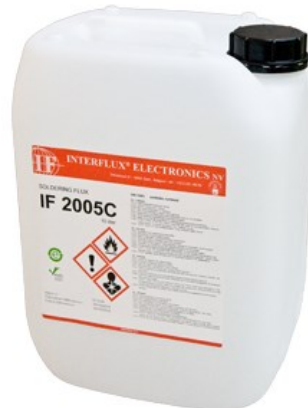
La photo n'est pas contractuelle

Le flux est classé dans les normes IPC et EN comme OR/L0.