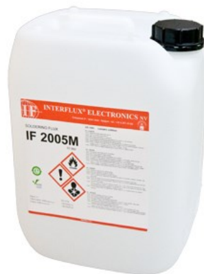
La photo n'est pas contractuelle

Le flux IF 2005M peut être utilisé dans les stylos rechargeables pour le brasage manuel.